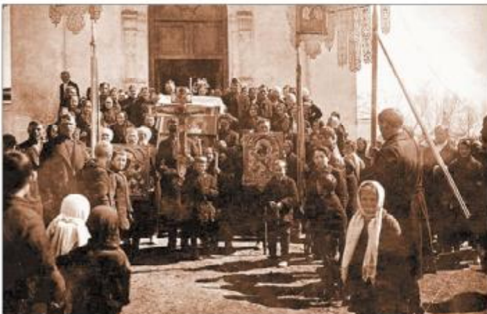
Крестный ход в Троицком-Голенищево Ок. 1923 г.