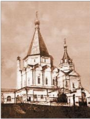
Троицкий храм с. Голенищево 1920-е гг.