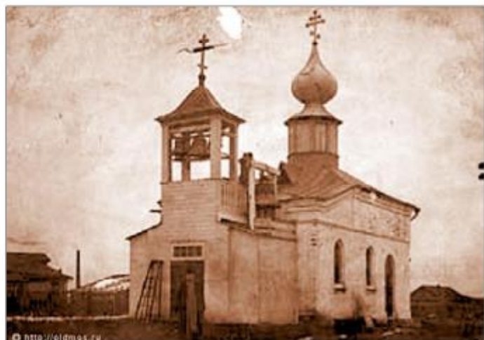
Георгиевский (Покровский) храм в с. Хомятино 2009 г. Троицкий храм в с. Семеновском Кон. 1920-нач. 1930-х гг.